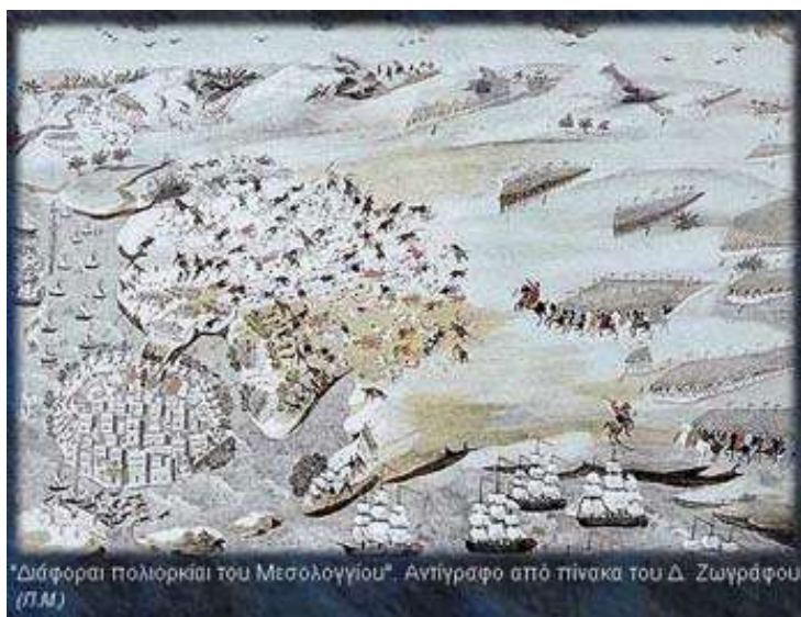
"Διάφορα πολιορκία του Μεσολογγίου". Αντίγραφο από πίνακα του Δ. Ζωγράφου. (Π.Μ.)

15 Απριλίου 1825 Αρχίζει η δεύτερη πολιορκία του Μεσολογγίου από τον Κιουταχή και αργότερα και από τον Ιμπραήμ. Στις 10 Απριλίου 1826 θα γίνει η ηρωική έξοδος και η πτώση του Μεσολογγίου. Η θυσία του Μεσολογγίου προώθησε το ελληνικό ζήτημα όσο καμιά ελληνική νίκη και ο απόηχος των γεγονότων, αναζωπύρωσε το πνεύμα του φιλελληνισμού στην Ευρώπη.