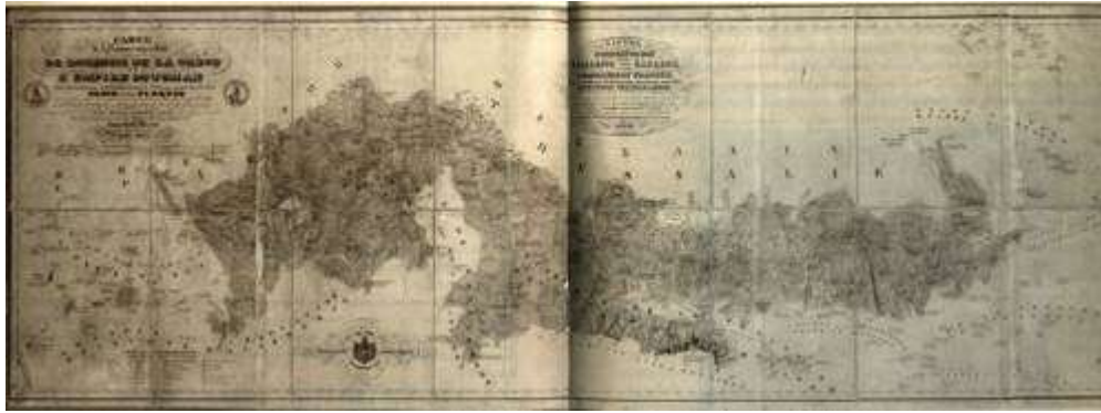
Χάρτης ορίων Ελλάδας - Οθωμανικού κράτους, του 1832 Карта с границами Греции и Оттоманской державы. 1832 г.

Ολοκληρώνοντας μπορούμε να πούμε ότι η δημιουργία ανεξάρτητου ελληνικού κράτους ήταν ένα γεγονός που η σημασία του δεν αφορούσε μόνο τους Έλληνες. Για τους Έλληνες απετέλεσε την επιβράβευση ενός σκληρού και αιματηρού εφτάχρονου αγώνα με πολλές θυσίες, ταυτόχρονα όμως η εθνική επανάσταση ενός λαού με ένδοξο παρελθόν, που επί αιώνες ήταν υπόδουλο, έδινε τη δυνατότητα να εκδηλωθούν τα φιλελεύθερα αισθήματα σε ολόκληρη την Ευρώπη που ζούσε κάτω από την πίεση απολυταρχικών καθεστώτων και αποτελούσε ένα προηγούμενο για τους λαούς που επιζητούσαν την ελευθερία τους, ιδιαίτερα για τους βαλκανικούς λαούς. Παράλληλα, η επανάσταση και η νίκη των Ελλήνων, προκαλώντας την ευνοϊκή επέμβαση των μεγάλων δυνάμεων, ήταν ένα ξεκίνημα για τη διάλυση της Οθωμανικής Αυτοκρατορίας. Ήταν μια διαδικασία που κράτησε σχεδόν έναν αιώνα. Στη διάρκεια αυτού του αιώνα ολόκληρη η περιοχή, η περιοχή μας, ήταν ένα καζάνι που έβραζε από εθνικισμούς και διεθνή συμφέροντα.